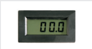
Luxometro digitale / Luxómetro digital / Digitalluxmeter / Digital Luxmeter