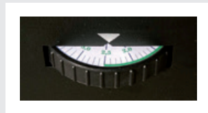
Settaggio inclinazioni / Adjuste inclinación / Neigungseinstellung / Inclination setting