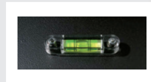
Bolla di stabilità / Stability lever / Hebel für Stabilitätskontrolle / Nivel de estabilidad