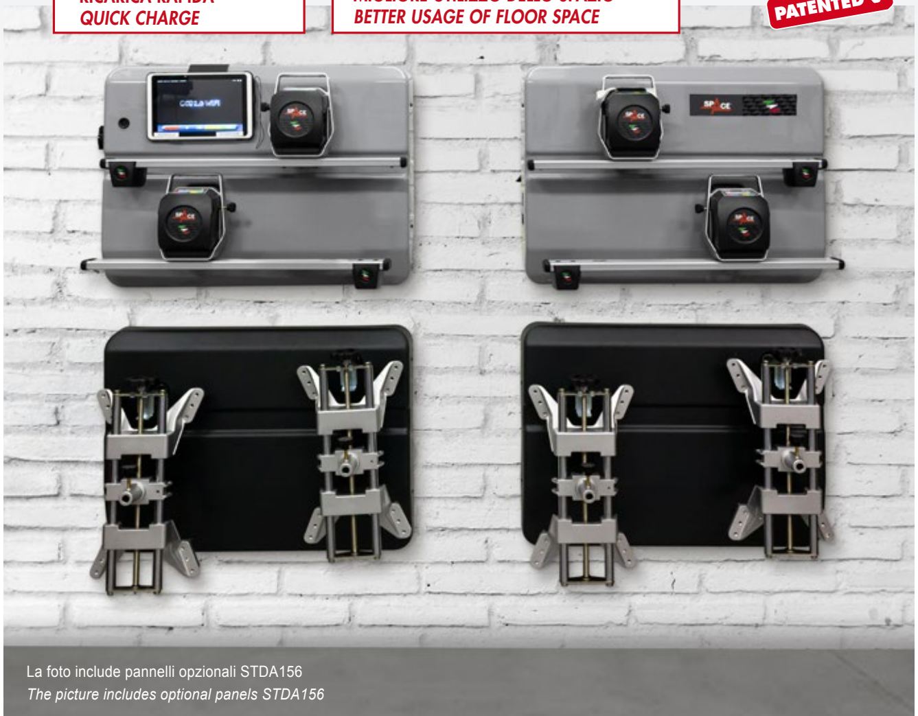
La foto include pannelli opzionali STDA156 The picture includes optional panels STDA156

Due pannelli a parete per l'alloggiamento e la ricarica del tablet e dei rilevatori. Two wall panels allow housing and recharging of tablet and measuring-heads. Zwei Wand-Panele mit Ablage und Ladestation des Tablets und der Messköpfe. Deux panneaux muraux pour rangement et charge de la tablette et des têtes. Dos paneles de pared para almacenamiento y carga de los captadores.