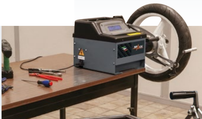
Standard GAR181N (>14mm)

Equilibradora electronica con altas prestaciones de rapidez y precisión. Lanzamiento unico de motor y bloqueo automatico al final del ciclo.