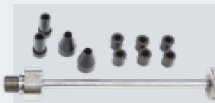
GAR356 (Ø 10 mm) GAR182N (Ø 12 mm)